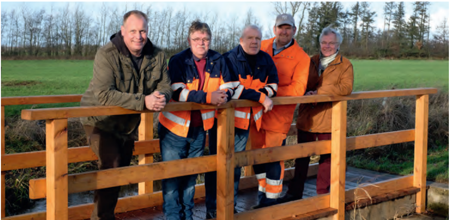
Brückenbau – siehe Seite 3