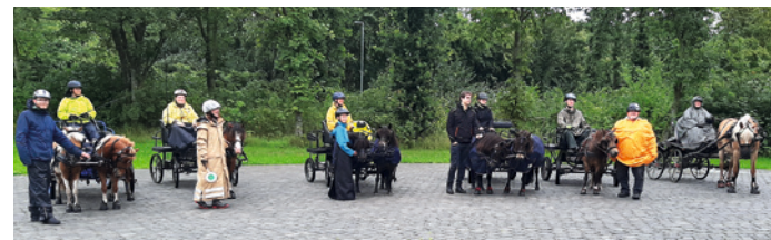
Teilnehmerinnen und Teilnehmer des Fahrerlagers

Zum zweiten Mal wurde in der Gemeinde Hörup das Fahrerlager ausgerichtet. 15 Teilnehmer ab 14 Jahre aus allen Teilen Schleswig-Holsteins und ihre 7 Gespanne trafen sich zum fünftägigen Fahrerlager in Hörup. Es kamen Fahrerinnen und Fahrer aus allen Sparten zusammen.