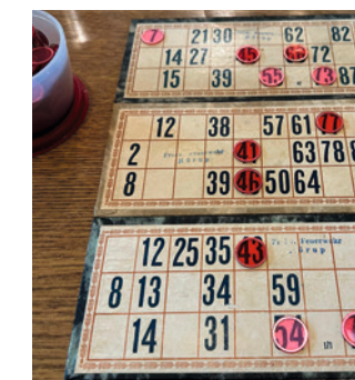
Als Gewinn winkten Lebensmittelpreise.