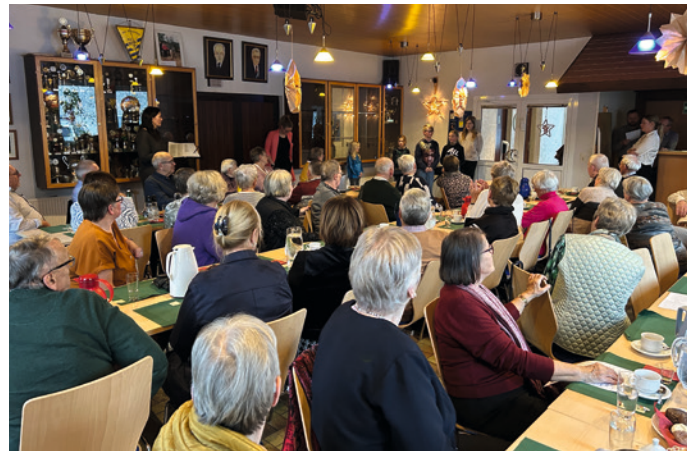
Tombola, unterhaltsames Rahmenprogramm ...

Am Sonntag, den 1. Advent, hieß es wieder für die Höruper Senioren: Ü65-Weihnachtsfeier.