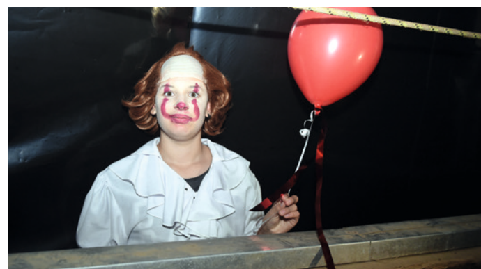
Das wurde ganz schön heiß unter den Masken: Die Gruselgestalten hatten gut zu tun ...

eine männliche Stimme. „Ich habe ein Blitzlicht, das hilft“, scherze ich. Prompt wird gekontert: „Das wirkt nicht, ich habe