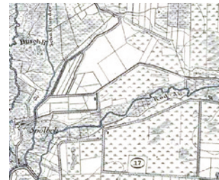
Schafflunder Mühlenstrom, Spölbek u. Rodau

Up de Rüchweg wur ein Sack (100 Pundt) Roggenmehl bi Bäcker Friedrichsen in Stadum aflodet. Dor gev dat dördich Brote för een Sack Roggenmehl, de bi Bedarf afholt wurn.