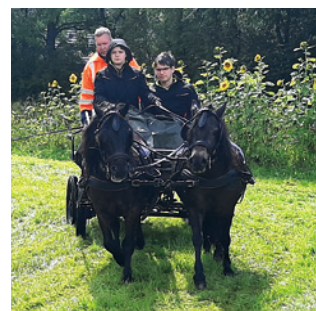
Training und Gespannkontrolle

Und dann war es schon wieder vorbei. Es waren für alle ganz tolle Tage mit sehr viel Spaß.