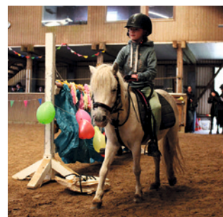
Spaß im Parcours für Mensch und Tier

in den Pfützen, die sich auf dem Außenplatz gebildet hatten. Im Anschluss wurden alle mit einem kleinen Präsent belohnt und die Sieger geehrt.