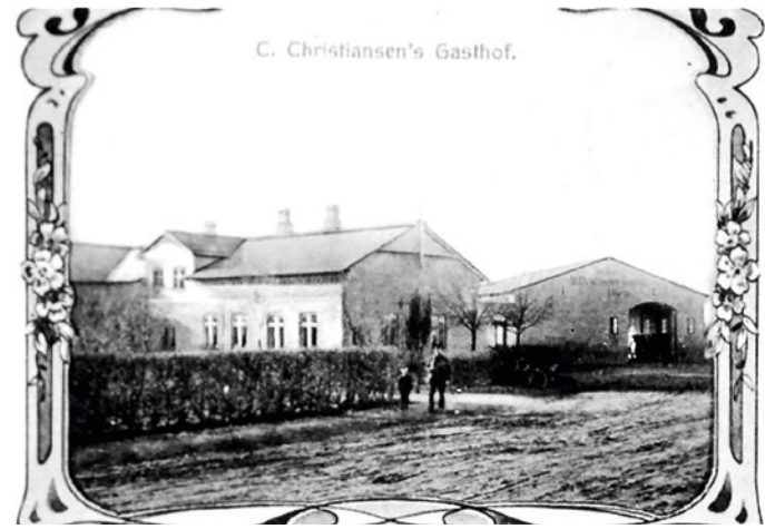
Gaststätte „Carsten Eck“