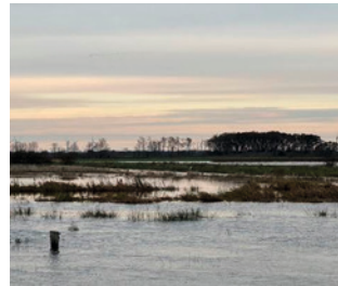
Spölbek twischen de Auen mit Blick op Possenbarg (Buschberg)

makte. Dat Heu mit samt de Diemen ging af in de Soholmer Au. Wenn dat hüt mal een Sturmflot givt, de noch een beten duller utfallt, geiht Spölbek wull toerst ünner.