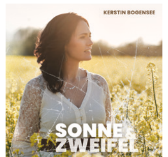
Die neue CD – erhältlich ab Februar

Pünktlich zur Veröffentlichung spielte ich ein Konzert im Leck-Huus. Das erste Mal mit Band!