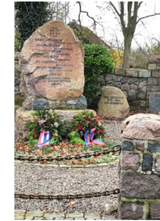
Kränze am Ehrenmal

Ich hoffe, euch in der Sommerausgabe schon Konkretes berichten zu können, bin aber optimistisch, dass dann etwas zu sehen ist.