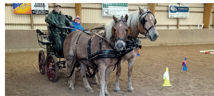
Für Groß und Klein eine richtig schöne Veranstaltung

Elfen, Hexen, Wikinger, Gespenster, kleine Drachen und noch viele andere Gestalten machten sich auf den Weg, um auf einer der vier Strecken Fragen zu beantworten und die fehlenden Buchstaben zu suchen, die sie für ihr Zauberwort