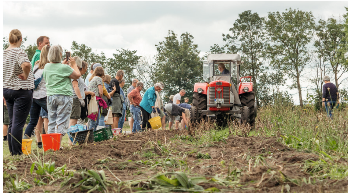
Großer Andrang am Kartoffelacker

Am 3. September war es wieder so weit: Die Kartoffeln auf der Festwiese konnten geerntet werden. Die Ausbeute war richtig gut und alle hatten ihren Spaß.