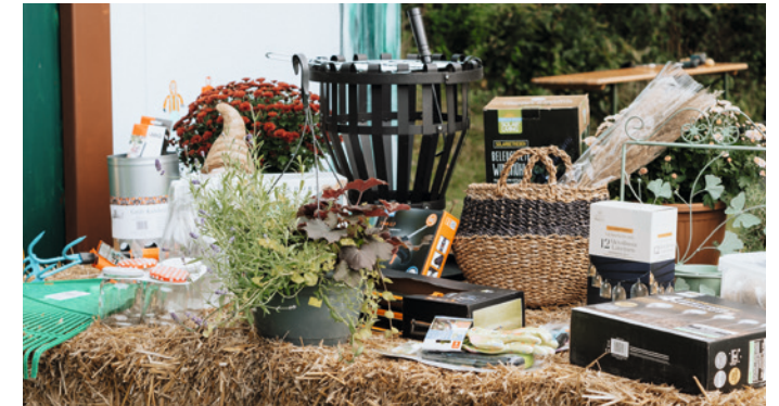
Begehrte Preise bei der Tombola des DVV. – Bild: Besucher