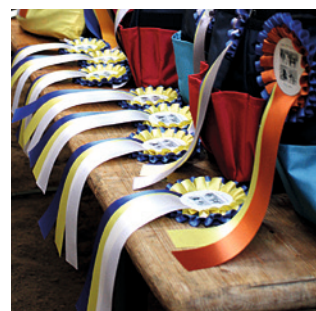
Die begehrten Trophäen