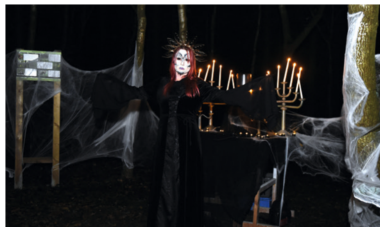
Nervenkitzel an jeder Ecke

Die Besucher brauchen nur rund 20 Minuten – wenn sie sich nicht verlaufen. Ein sperriger Anhänger auf einer dunklen Lichtung, die an einem normalen Tag ein Sportplatz sein könnte, lässt einige den richtigen Weg verfehlen. Bald geht es die Treppe hinunter. Geschafft, meint man. Aber plötzlich geht es noch in