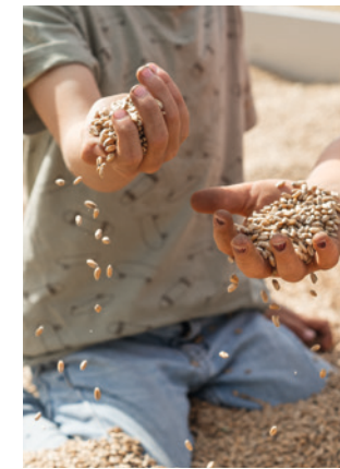
Oben: Kornbad. – Bilder o.Ju.: Svenja Lingat