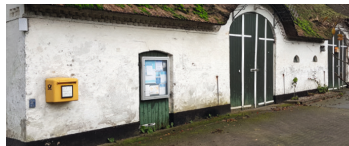
Der Briefkasten an dieser Stelle in der Osterstraße ist bald Geschichte.

Die Kauf ist für Anfang 2024 geplant und wurde bereits im Haushalt berücksichtigt. Der Standort des Gerätes soll beim Feuerwehrgerätehaus sein. Sobald das Gerät instal-