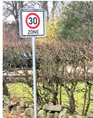
Es gilt „rechts vor links“ in 30er Zonen!

Hörup ist ein klasse Dorf mit einer super Dorfgemeinschaft.