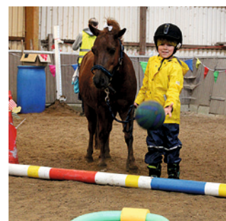
Auch die Kleineren bewiesen Geschicklichkeit!

Es war ein ganz toller Tag mit vielen Zuschauern.