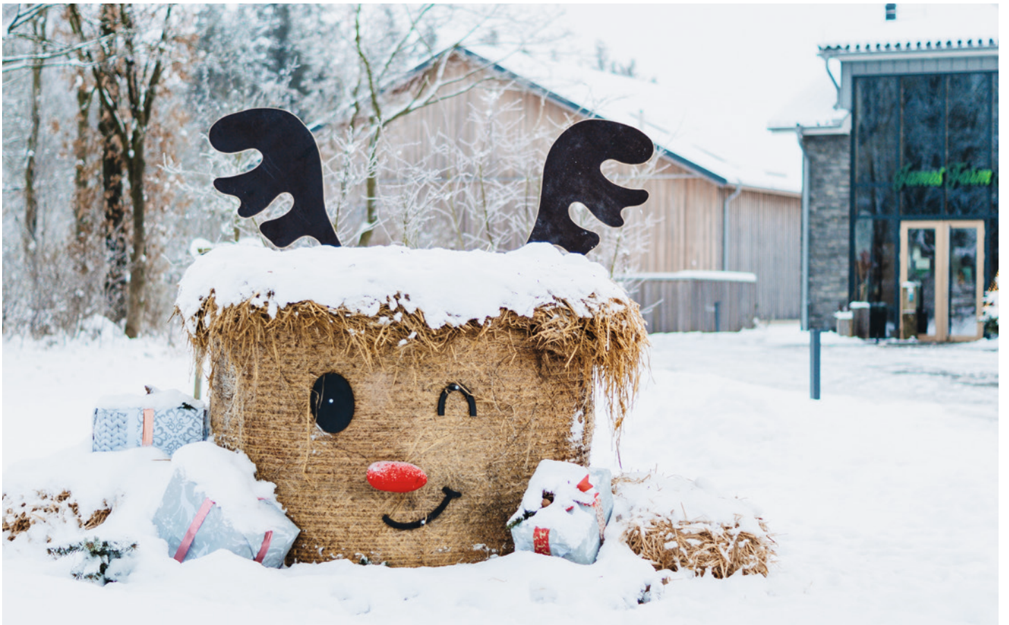
Höruper Adventsfiguren: Idee von Xenia Bartelsen und mit vielen fleißigen Helferinnen und Helfern umgesetzt.