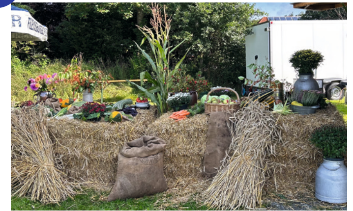
Ernteecke, liebevoll geschmückt.