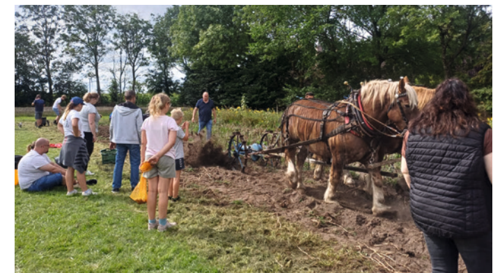
Beste Ernte – auch Dank der Pferde. – Bild: Maike Pleger