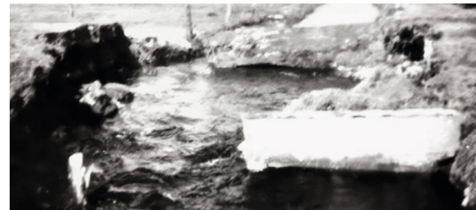
Ein Graben (Nebenarm des Schafflunder Mühlenstroms), welcher direkt am Haus Dibbern verläuft. Dort ist 1933 eine Brücke weggespült worden.