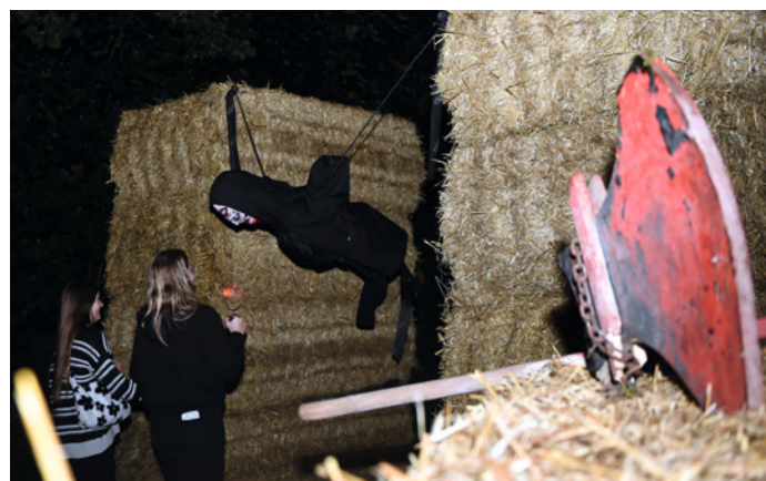
Vier Stunden Nervenkitzel an vielen Stationen

Gruseln, Schauern und Fürchten sind alle zwei Jahre ein Kollektivereignis auf der Geest. Der „Höruper Horrorwald“ wirkt wie ein Magnet des Schreckens.