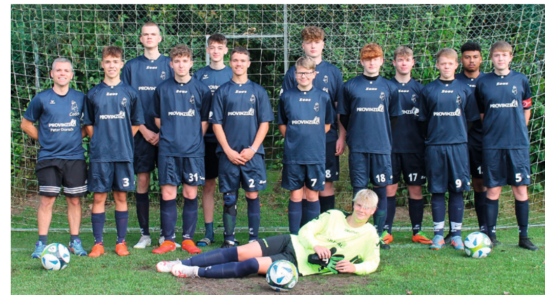
Dank der Sponsoren und des Trainers: Es geht weiter mit der Jugendmannschaft des HSC Hörup!

die Reithalle, die sich in ein Labyrinth verwandelt hat. An jeder Ecke lauern Gespenster, gefallene Engel oder auch „Chucky“, die Mörderpuppe. „Das war ja noch einmal richtig gut“, meinen zwei Jungs. Ihr Vater atmet tief durch: „Ihr beide seid mir so zwei Gestalten.“