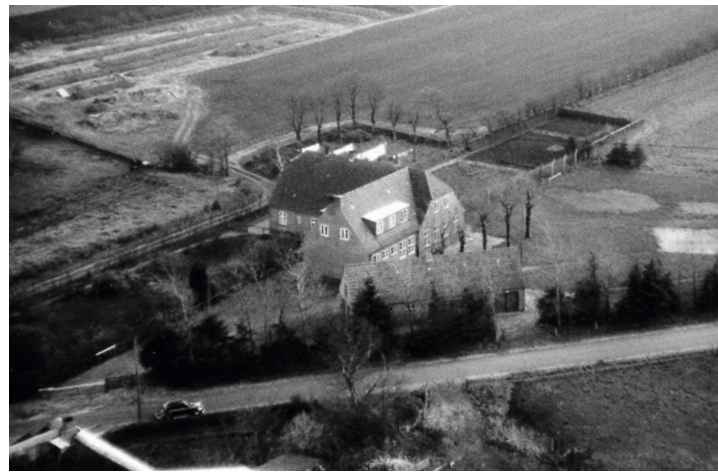
Luftansicht Schule Hörup